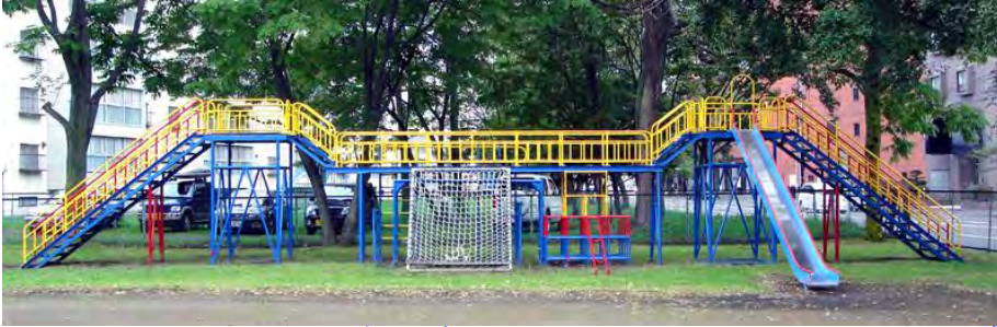
子どもたちを待つグラウンド