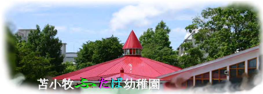
苦小牧ふたば幼稚園