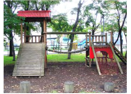
遊びを創るふたばの森