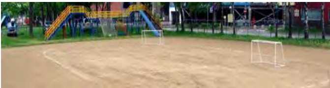
生き生き元気なふたばの子