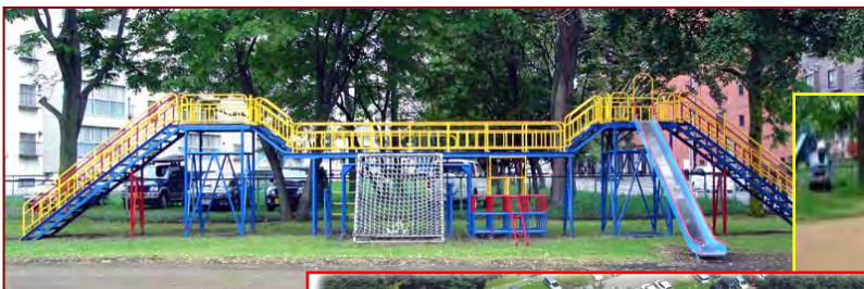
大型遊具と広いグラウンド