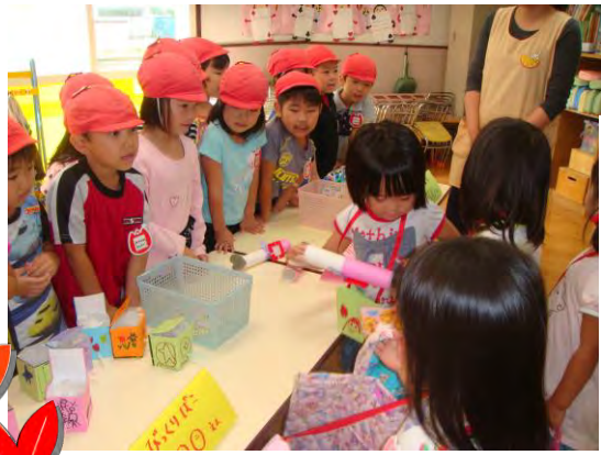
お店屋さんごっこ