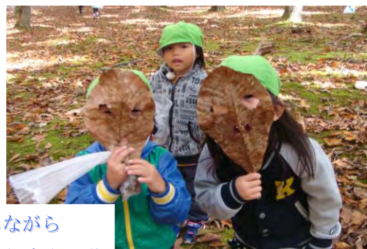
季節を感じながら 四季折々の行事や活動 を楽しみます。