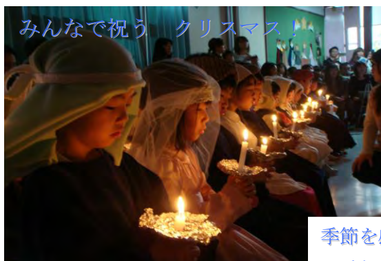
みんなで祝う クリスマス