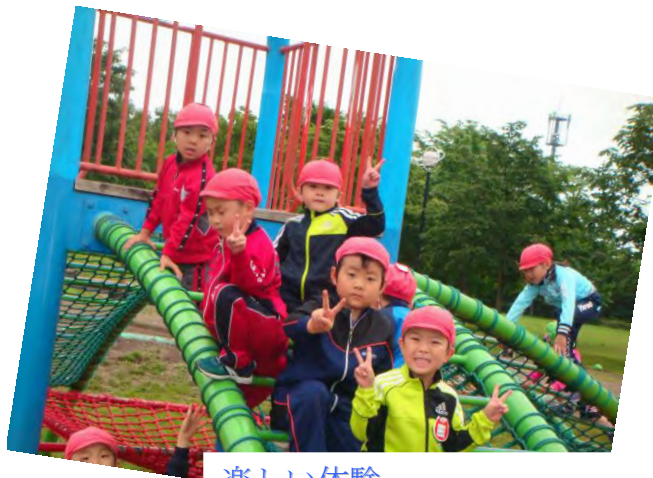
楽しい体験 新しい体験がいっぱい！