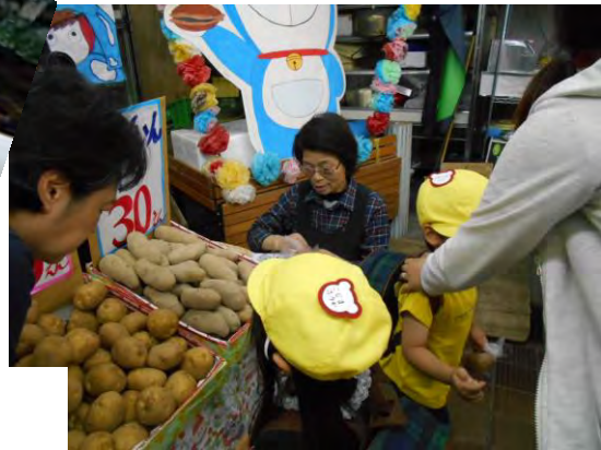
お買い物体験 お母さんみたい！ お店屋さんごっこの前に