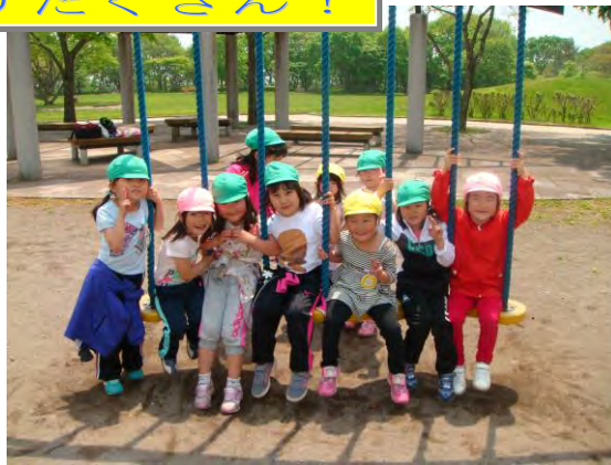
ふたばの子は みんな仲良し！